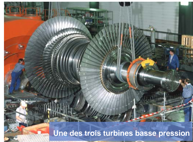
Une des trois turbines basse pression