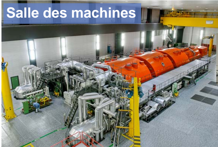
Réservoir d'eau d'alimentation dans la salle des machines