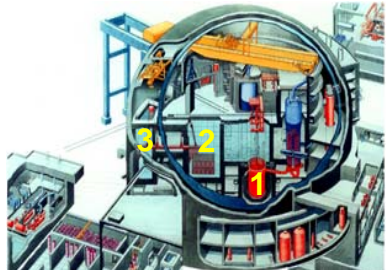
Nr. 1- Réacteur Nr. 2- Piscine du combustible Nr. 3- Piscine de rechargement