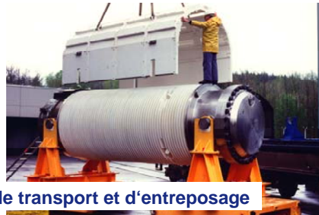
Conteneurs de transport et d'entreposage

Les assemblages combustibles usés sont préparés pour le transport