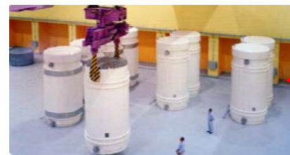
Dépôt intermédiaire central