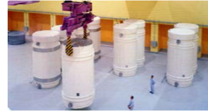
Zentrales Zwischenlager ZWILAG