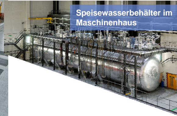
Speisewasserbehälter im Maschinenhaus